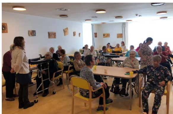
Bohoslužby pro seniory v Ivančicích