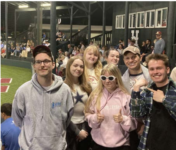
Hejnická SŠJB v USA